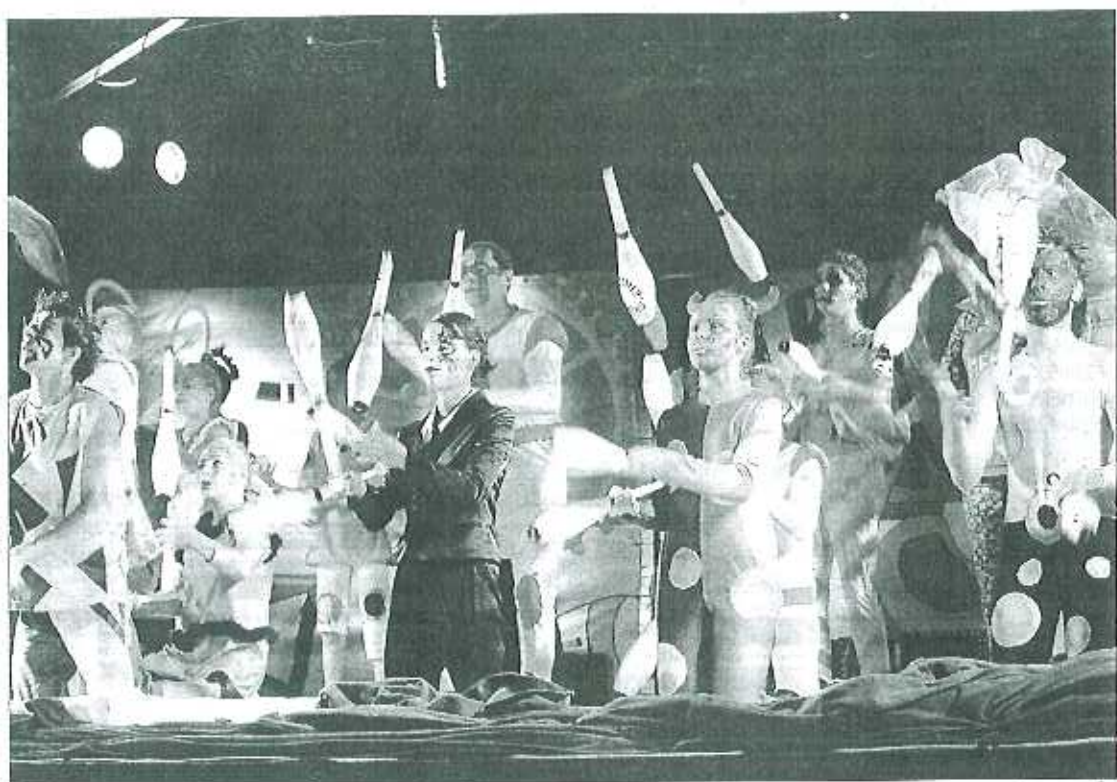
La pratique des arts du cirque en milieu scolaire se développe.

Le Service départemental UNSS 17, responsable de l'organisation de ce 3 e festival national des arts du cirque, habitué à de tels challenges, s'appuie sur une équipe organisatrice constituée d'enseignants d'EPS, mis à disposition par l'inspection d'académie, très sensible aux valeurs éducatives d'un tel projet. La