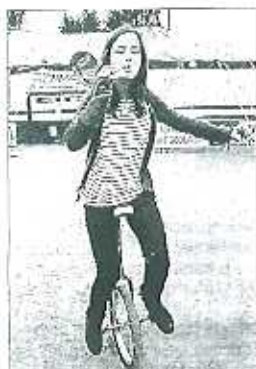
Certains semblent à l'aise...