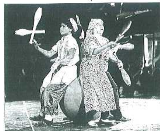
En costume, en musique et en cadence