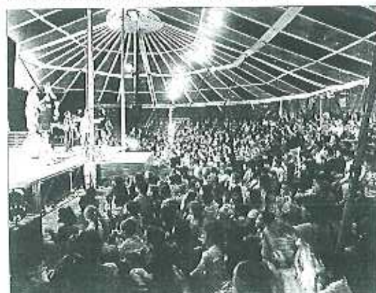
Hier, il y avait foule sous le chapiteau dressé à l'espace Pompidou