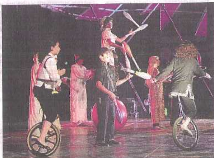
Ingéniosité et travail : deux ingrédients du succès.

450 élèves et une soixantaine de professeurs ont ainsi partagé, pendant trois jours, leur passion pour le jonglage, l'acrobatie, les clowne-