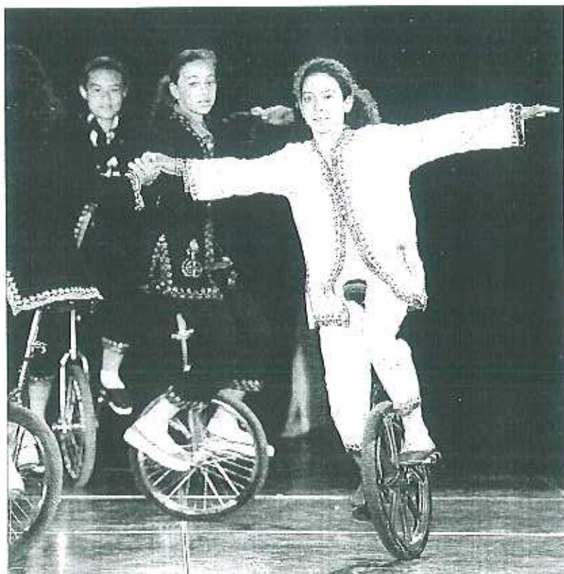
Durant trois jours, les jeunes ont enchaîné les spectacles, comme des pros.