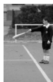
du côté opposé à l'assistant