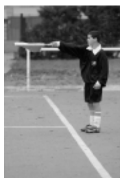
au milieu du terrain