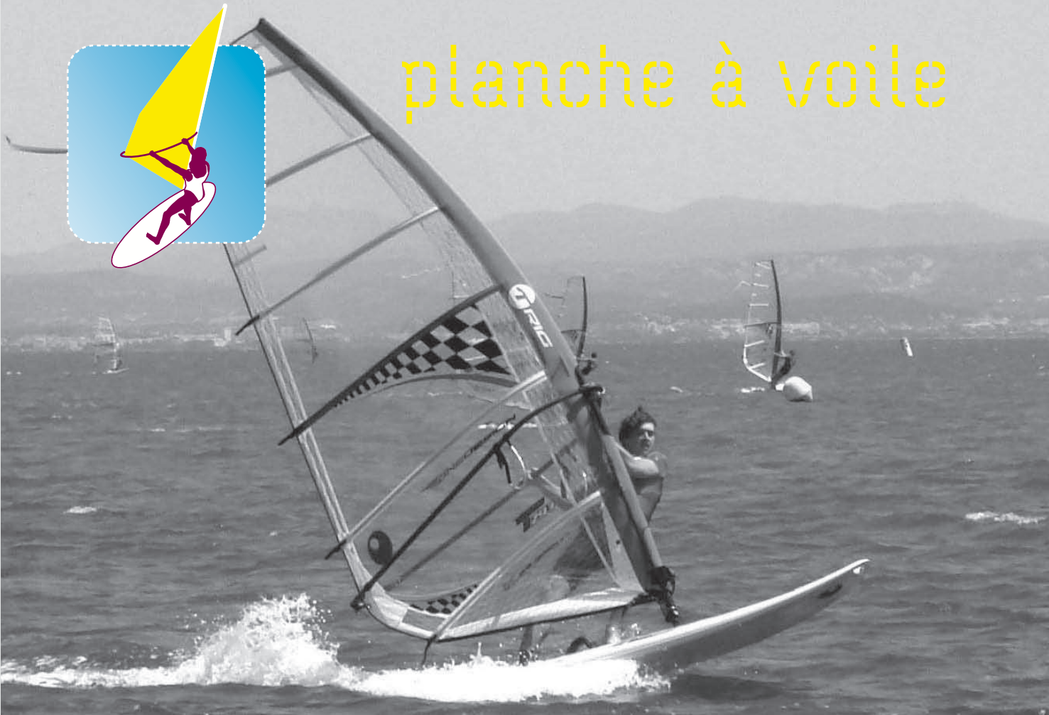
planche à voile