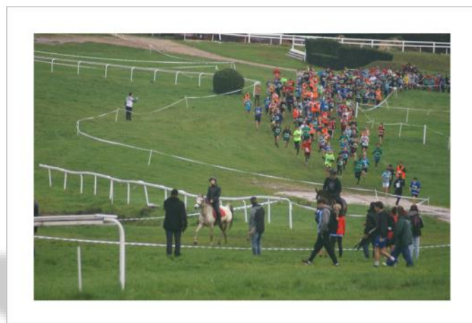
Photos du CROSS du DEPARTEMENT Nov 2022 à POMPADOUR