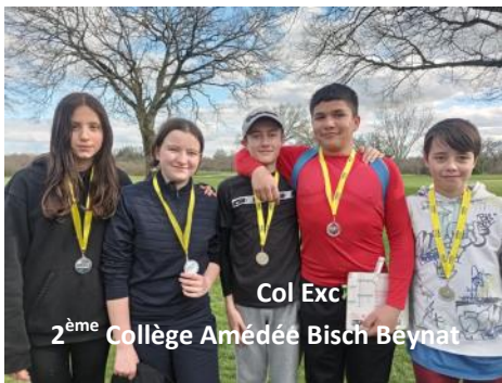
Coll Exc 2 ème Collège Amédée Bisch Beynat