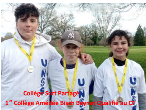
Collège Sport Partagé 1 er Collège Amédée Bisch Beynat Qualifié au CF