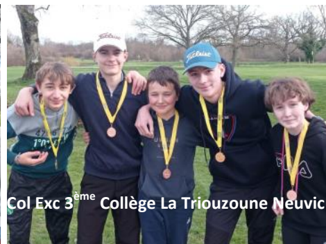
Coll Exc 3 ème Collège La Triouzoune Neuvic