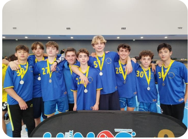
HANDBALL MG : J. Rostand Capbreton Vices Champions Académique