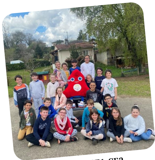
Classe de CE1-CE2

La Mascotte se promène dans les établissements landais. Cette semaine elle était à l'école de BOUGUE. Les élèves ont organisé une journée spéciale autour des Jeux Olympiques/Paralympiques.