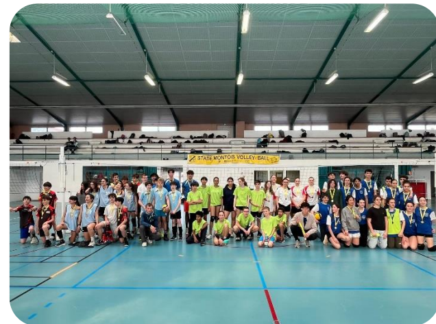
VOLLEYBALL : à Wlérick Mdm