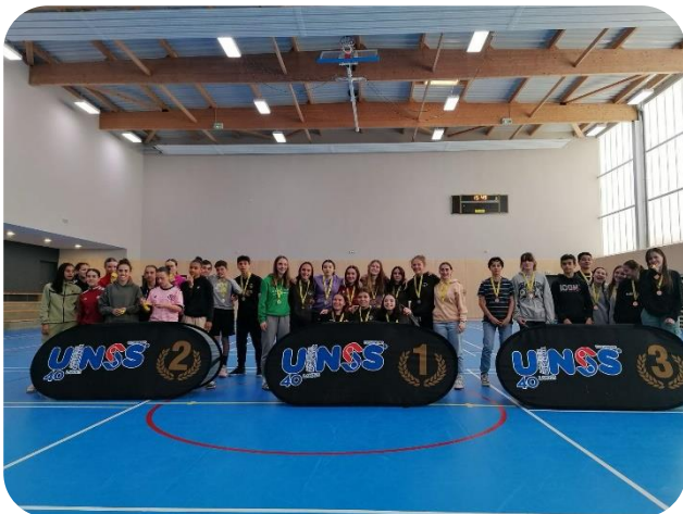
HANDBALL : Podium MF