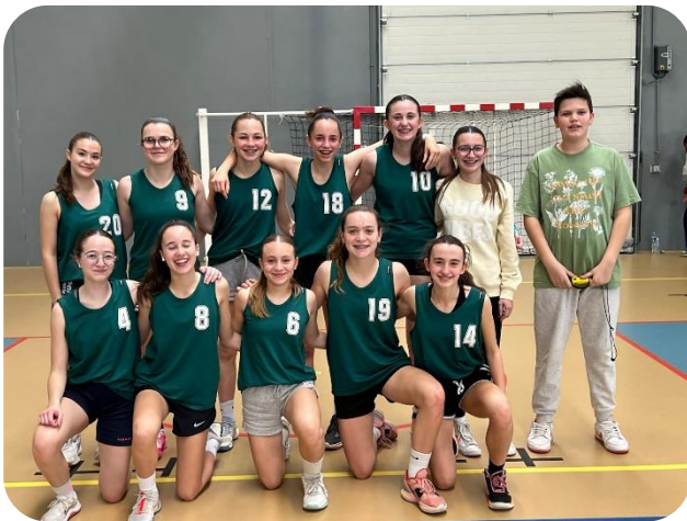
BASKET MF : AMOU Vices Championnes Académique