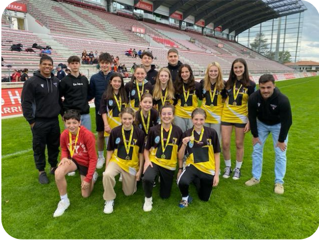
RUGBY MF - LINXE : Championnes aux Acad ! Rdv le 10.04 pour les Inter-Acad à St Loubès (33).

Une belle journée sportive ! Bravo à tous. Nous tenons également à féliciter les JO certifié(e)s niveau académique !