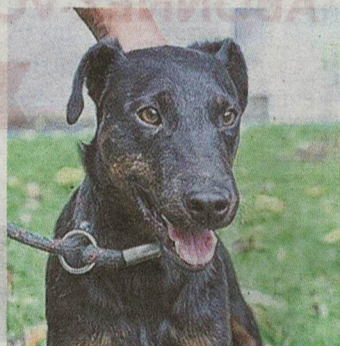
Spot attend ses maîtres.

Contact : SPA de l'Indre, refuge de Rosiers, ZI La Malterie 36130 Montierchaume. Tél. 02.54.34.74.27. Du lundi au samedi (sauf jours fériés), de 13 h à 17 h, adoption sans rendez-vous. E-mail : spa.indre@orange.fr Site internet : www.spa36.fr